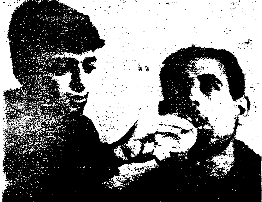
بعد ان اصابه التعب وكاد الضرب يقهده رشده : أحد المواطنين الصربي خليفة اربعا يتناول كأسا من المساء من احد جنود الاحتلال الاسرائيلي . وهذا الشاب العربي واحد من ثمانية شبان اعتقلهم الاسرائيليون ومذبوحهم في اعتقال مظاهرة اربعا «صورة لاسبوعية»

الاربعاء في ٨ شعبان سنة ١٣٨٨ هـ الموافق ٣٠ تشرين الاول سنة ١٩٦٨ م رقم العدد ٥٢٢